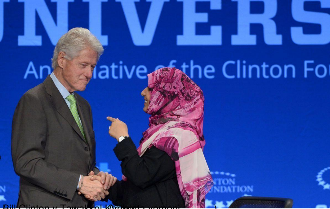
Bill Clinton y Tawakkol Karman en un momento de la conferencia )